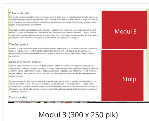
Modul 3 (300 x 250 pik) Stolp (300 x 600 pik)