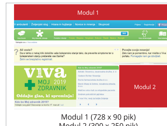
Modul 1 (728 x 90 pik) Modul 2 (300 x 250 pik)