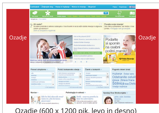
Ozadje (600 x 1200 pik, levo in desno)

ozadje, billboard, instream video, stolp do 100 KB, ostale pasice do 50 KB.