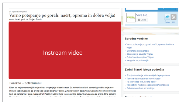
Instream video (720 x 405 pik)